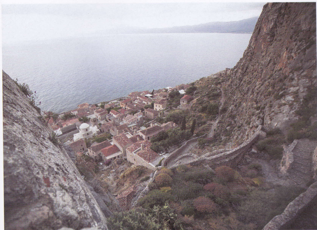
Fig. 60 Vedere Monemvasia