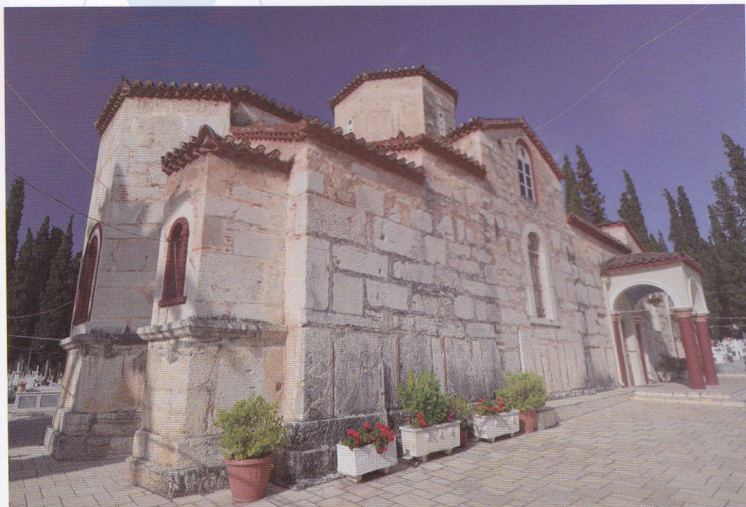
Fig. 59 Biserica Maicii Domnului din Argos