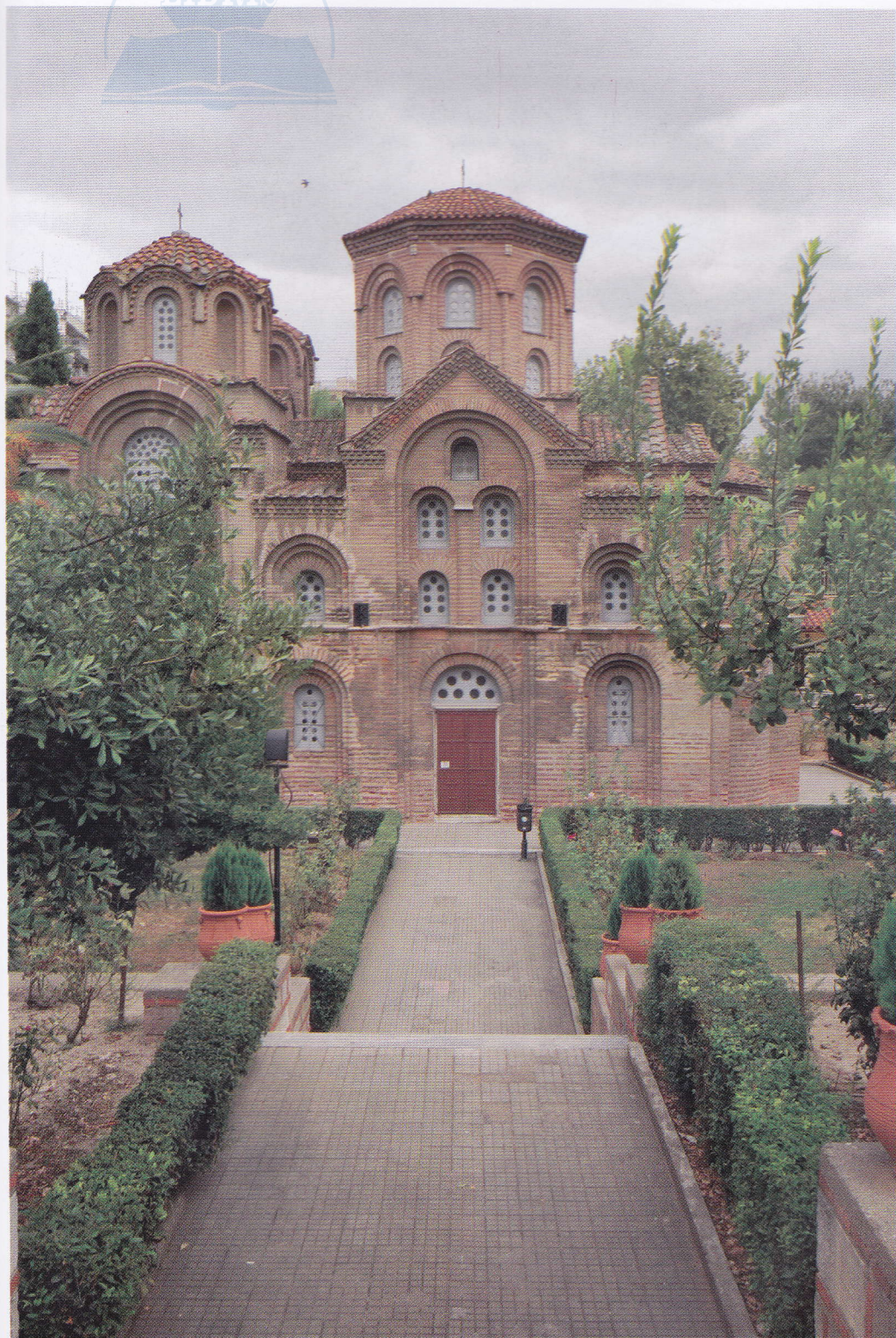
Fig. 44 Biserica Panaghia Chalkeon, Salonic